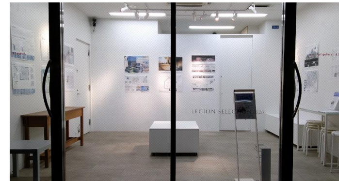
art gallery&Legion に展示

2024 年度は、5 校から 8 作品・14 名の方がミネートされ、最優秀作品賞 1 点、優秀作品賞 2 点が選出されました。